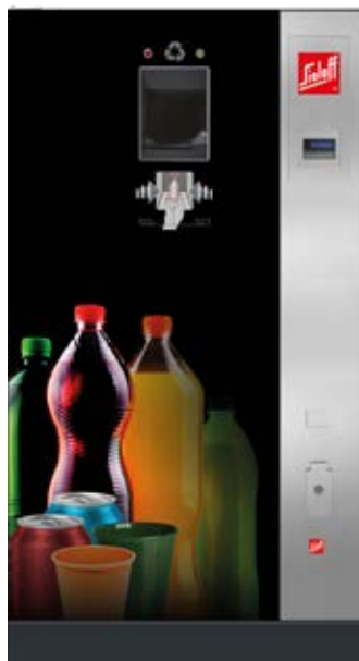
SiOne EB (Beispiel Design A „Colour Explosion“ – Flaschen/ Dosen/Becher bunt )