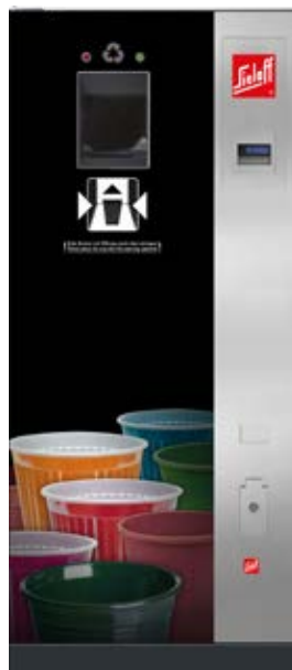
SiOne Small EB (Beispiel Design B „Colour Explosion“ – Becher bunt)