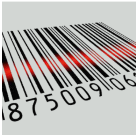
Vielfältige Möglichkeiten der Produktannahme über den Strichcode

Dank unserem konzeptionell durchdachten, wartungsarmen Betrieb ist Profitabilität an allen Aufstellplätzen garantiert.