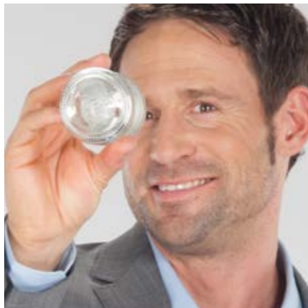
Einfache und sichere Annahme durch Einlegen des Leergutes