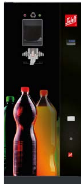
SiOne Small RB (Beispiel Design C „Colour Explosion“ – Flaschen bunt)